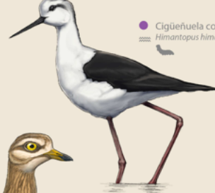
Cigüeñuela común Himantopus himantopus