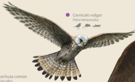
Cernícalo vulgar Falco tinnunculus