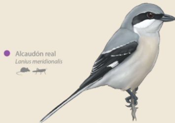
Alcaudón real Lanius meridionalis