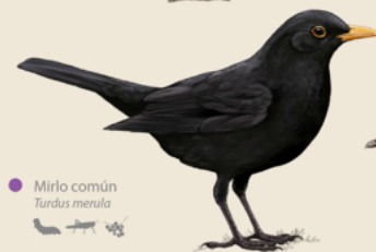
Mirlo común Turdus merula