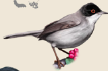
Curruca cabecinegra Curruca melanocephala