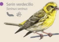
Serín verdicillo Serinus serinus