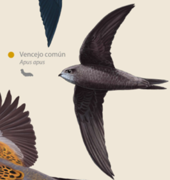
Vencejo común Apus apus