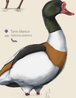
Tarro blanco Tadorna tadorna