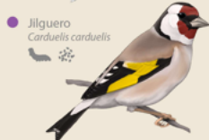
Jilguero Carduelis carduelis