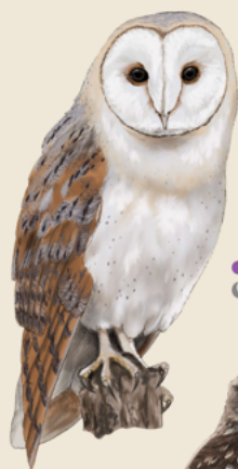
Lechuza común Tyto alba