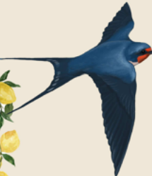
Golondrina común Hirundo rustica