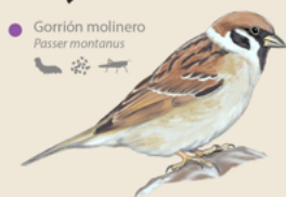
Gorrión molinero Passer montanus