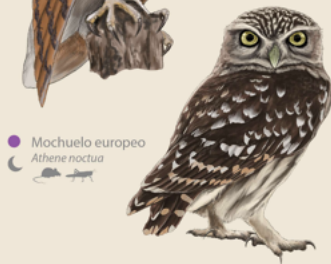
Mochuelo europeo Athene noctua