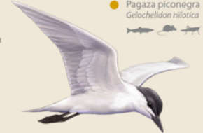
Pagaza piconegra Gelochelidon nilotica