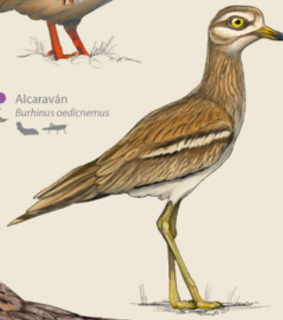
Chotacabras cuellirrojo Caprimulgus ruficollis