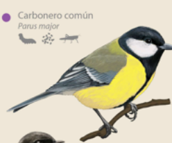
Carbonero común Parus major