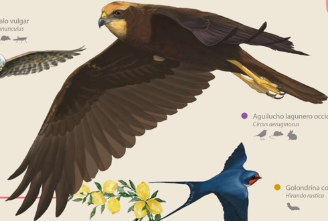
Aguilucho lagunero occidental Circus aeruginosus