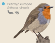
Petirrojo europeo Erithacus rubecula