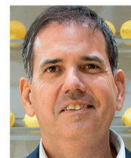
Por JOSÉ ANTONIO GARCÍA (*)

Incremento de la demanda a través del desarrollo de actuaciones de fomento y promoción del uso de zumo de