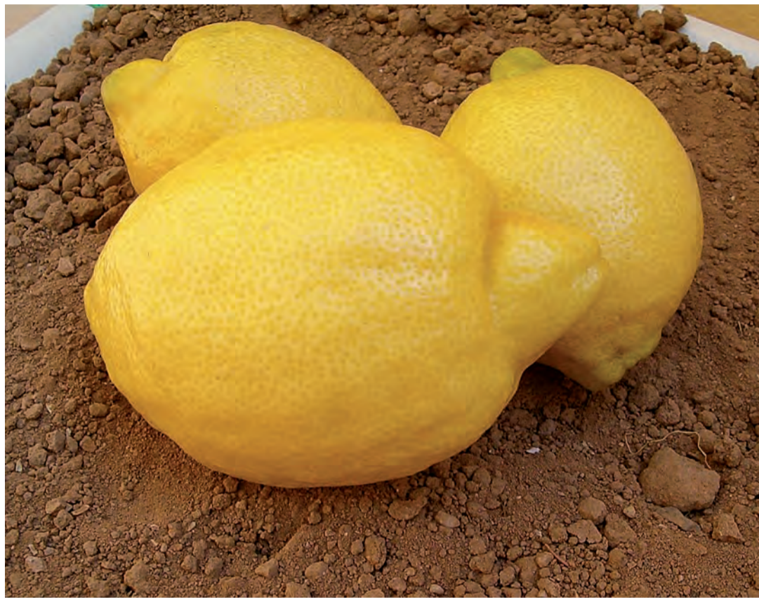
En los mercados comunitarios se han vendido 185.141 toneladas de limón.