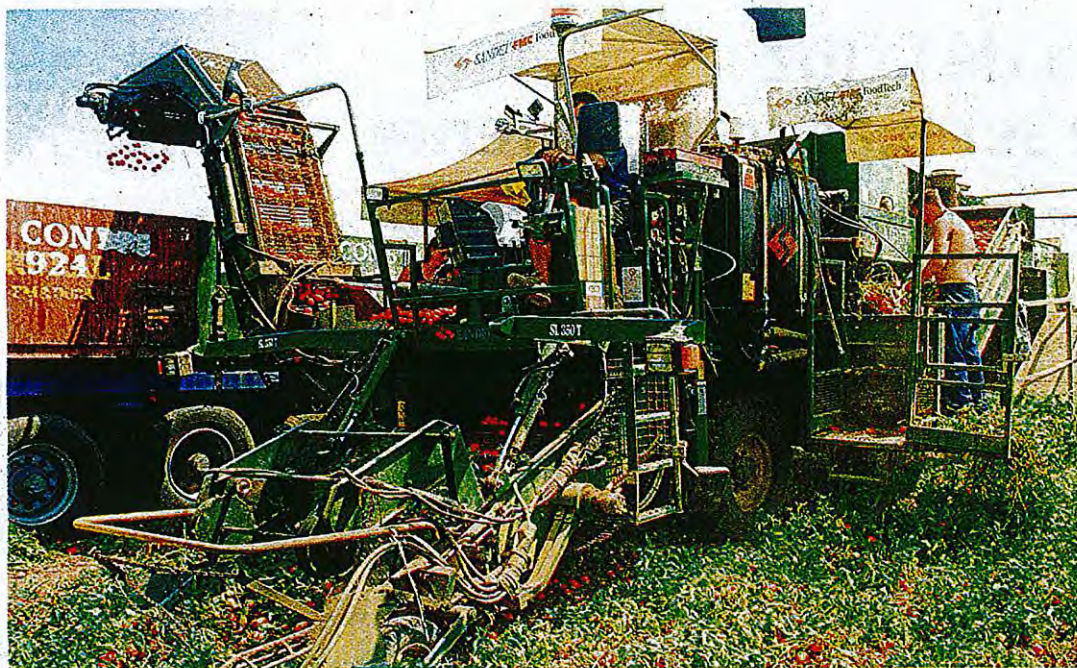
Imagen de archivo de una plantación hortofrutícola