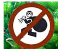
ROBO de FRUTA