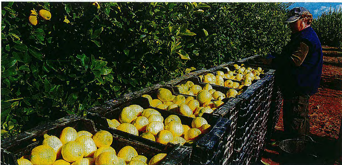
Limones recién recogidos en una parcela de la Vega Media del Segura.